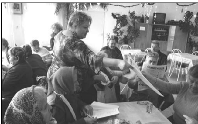
Az Ágasegyháza Naplót mindenki szívesen olvasta