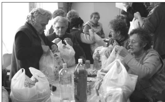
A csomagoknak mindeki örült