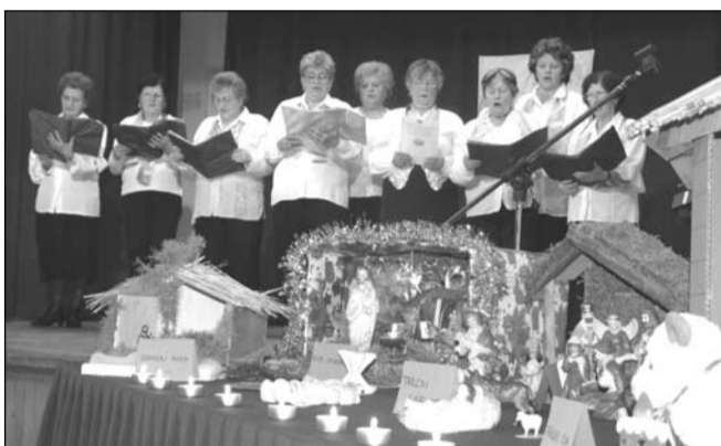
Jászolkiállítás ünnepi műsorral