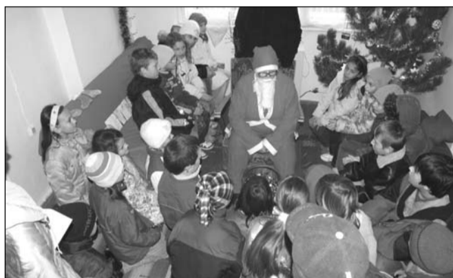
A gyerekek örültek a Mikulásnak