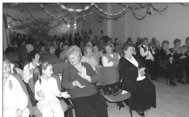
Jászolkiállítás gálaműsora nagy sikert aratott