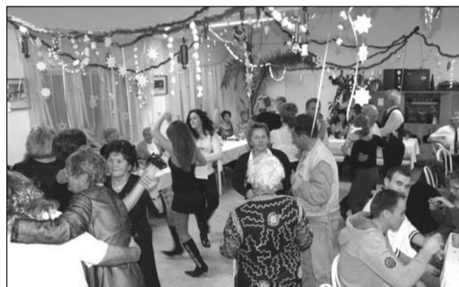
Az óvet mulatsággal búcsúztattuk